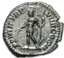
Silberdenar. Septimius Severus, 206 n. Chr., Rom.

Es war der Startschuss zu einer historisch und archäologisch sensationellen Entdeckung, als zwei Hobbyarchäologen im Sommer 2008 der Northeimer Kreisarchäologie einige Fundstücke zur Begutachtung vorlegten, auf die sie Jahre zuvor in einem Waldstück am Harzhorn gestoßen waren. Schnell konnte bestätigt werden, was zunächst unglaublich schien: Die Artefakte – Speer- und Katapultgeschoss-Spitzen, eine Pionierschaufel sowie eine eiserne Hufsandale – waren eindeutig römischen Ursprungs!