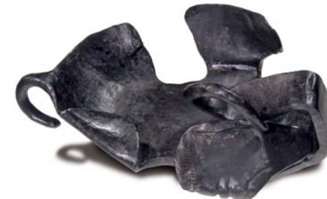
Hipposandale. Eiserner Schuh für Pferde oder Maultiere zum Schutz der Hufe im steinigem Gelände.

Ein anschauliches Bild von den Ereignissen des kriegerischen Aufeinandertreffens der römischen und germanischen Kampfverbände um 235 nach Christus vermitteln Ihnen Gästeführungen am Originalschauplatz. Ausgebildete „Harzhorn-Guides“ erläutern die historischen Hintergründe, beschreiben das Kampfgeschehen und ermöglichen einen Blick auf originalgetreue Repliken einiger Fundstücke.